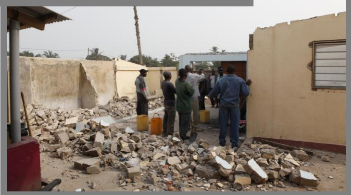
Baustelle Im Jahr 2011

Um ihre Situation zu verbessern und mehr Platz zu schaffen, wird zur Zeit ein neues Gebäude gebaut. Die Finanzierung des Erdgeschosses mit dringend benötigten Sanitäranlagen und einem Krankenzimmer ist zum größten Teil gesichert, aber auf das Flachdach soll noch eine weitere Etage mit Zimmern für die älteren Kinder gebaut werden. Hierfür fehlen noch 15.000.000 CFA (22.866 €). Mit Spenden - 20 € für jeden neuen Baustein - können sie die Zukunft der Kinder verbessern.